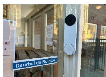
Deurbel De Bolster