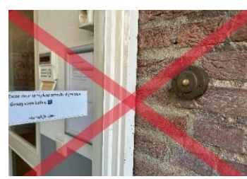
De oude deurbel