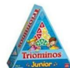
G0646 – Triominos junior