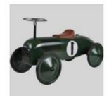
B3324 - Retro roller loopauto