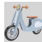
B3224 – Loopscooter van Little Dutch