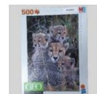
P2380 – Leeuwenpuzzel.