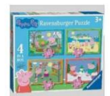
P4024 – 4 seizoenen puzzel van Peppa Pig