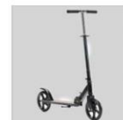
B0568 – Street scooter (step).