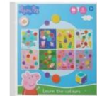
G3024 – Peppa Pig leer de kleuren.