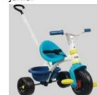
B2924 – Driewieler met duwstang