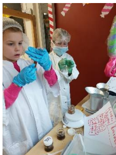
Groep 4A werkt in de snoepfabriek

Groep 6 heeft voorwerpen uit de Romeinse tijd onderzocht